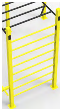
VERTICAL LADDER -SPROSSENWAND