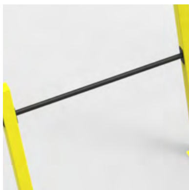
HORIZONTAL BAR- RECKSTANGEN 2 VERSCHIEDENE HÖHEN